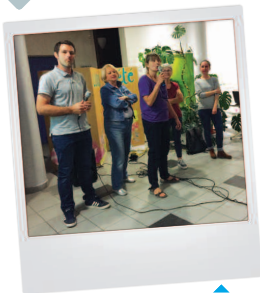
LE COLLECTIF D'HABITANTS porteurs du projet Mousticator lors du Conseil de ville de septembre 2018.