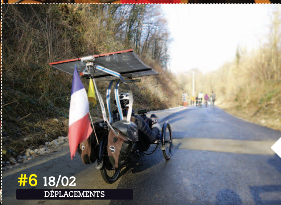
#6 18/02 DÉPLACEMENTS