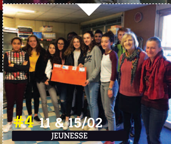
#4 11 & 15/02 JEUNESSE