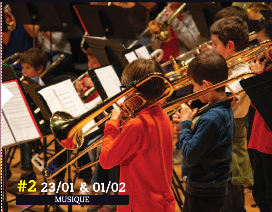
#2 23/01 & 01/02 MUSIQUE