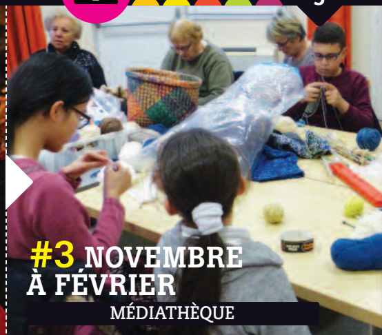
#3 NOVEMBRE À FÉVRIER MÉDIATHÈQUE