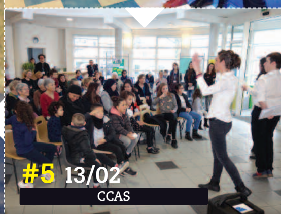
#5 13/02 CCAS